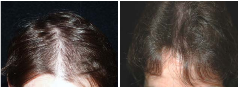
Ärztl. überwachter Versuch Februar 2004 und nach 6 Monaten